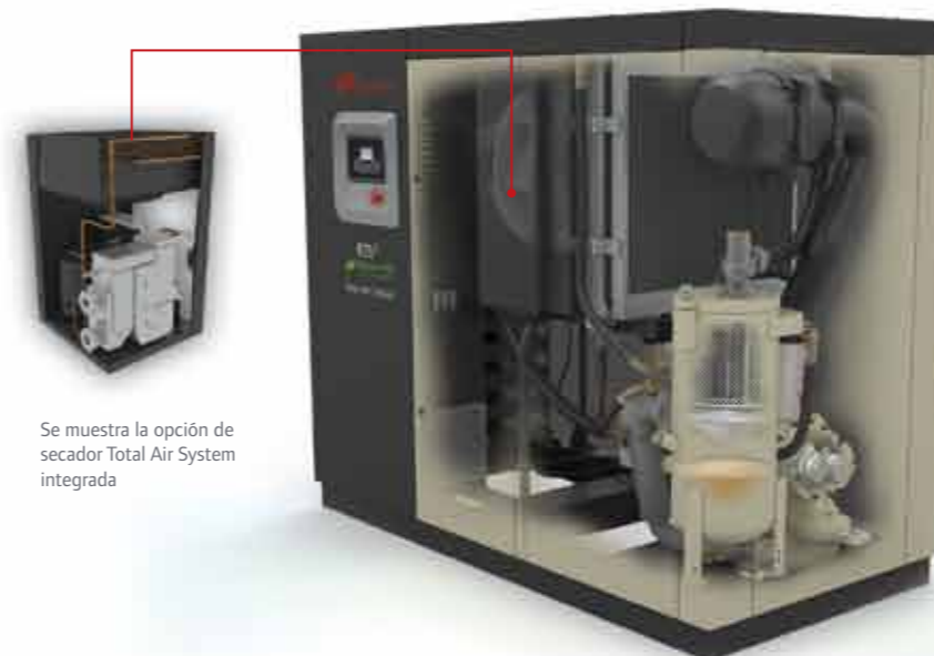
Se muestra la opción de secador Total Air System integrada