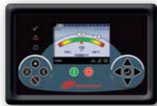
Xe-145M opción que aparece

La Serie R de compresores de aire rotativos de tornillo de Ingersoll Rand ofrece los mejores diseños y tecnologías, junto con funciones nuevas y avanzadas que aseguran los más altos niveles de fiabilidad, eficiencia y productividad disponibles.